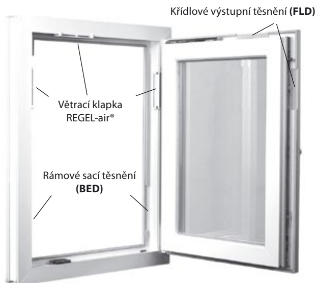
Příklad: 1,5 párů větracích klapek do funkční spáry REGEL-air® (=3 jednotlivé moduly (klapky))

Při montáži do horního rámu není třeba použít dodané plastové zpětné pružiny. Při vertikální montáži musí být plastové zpětné pružiny pokaždé před montáží nasazeny do pro to určeného otvoru. Pružina se nejdříve nasadí malým „zajišťovacím výstupkem“ do otvoru a pak se do otvoru zatlačí.